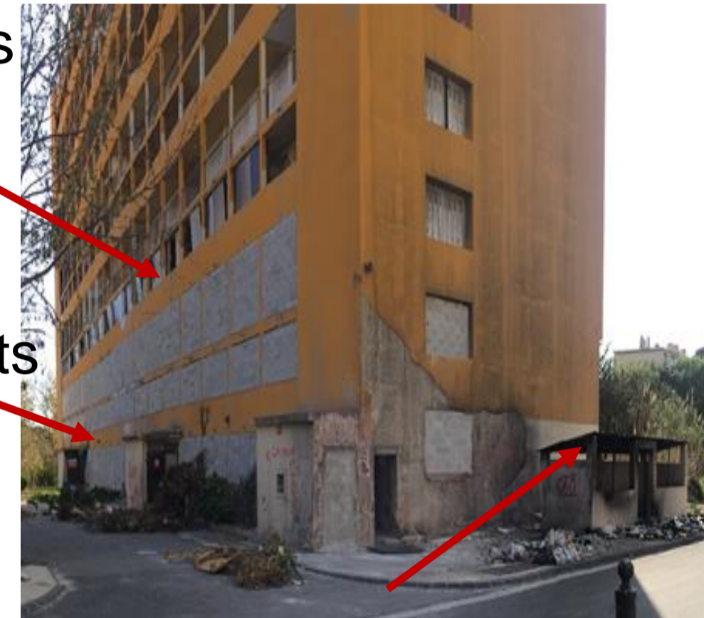
Local poubelles brûlé