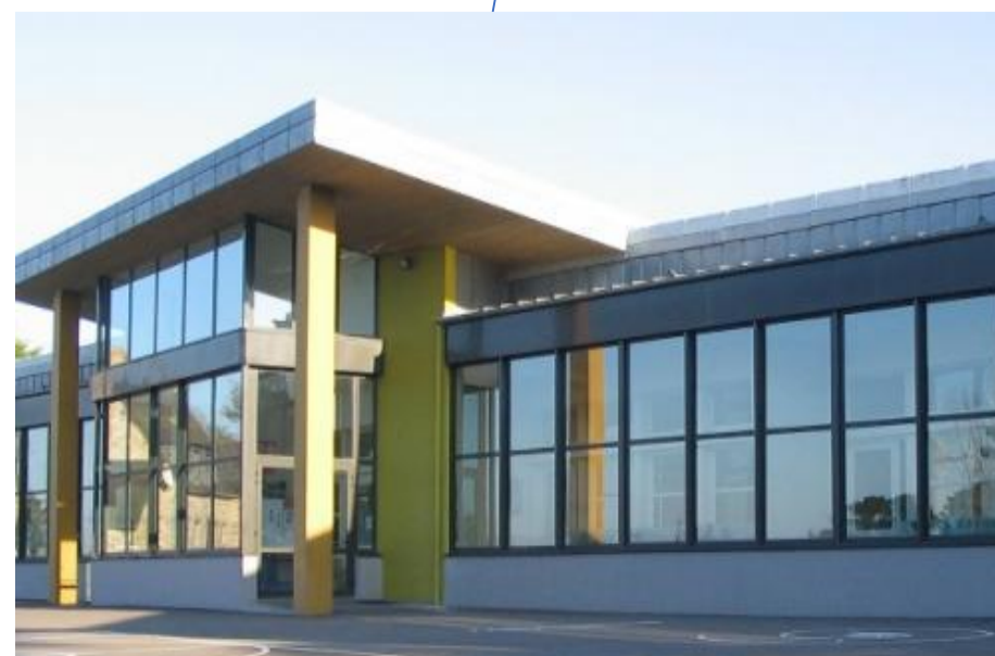
Exemple de bâtiment futur centre social « Corot ».