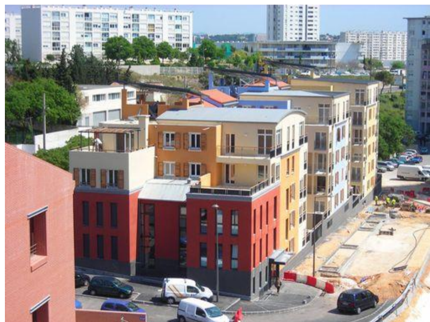
Exemple à suivre: les Flamants rénovés (14°)