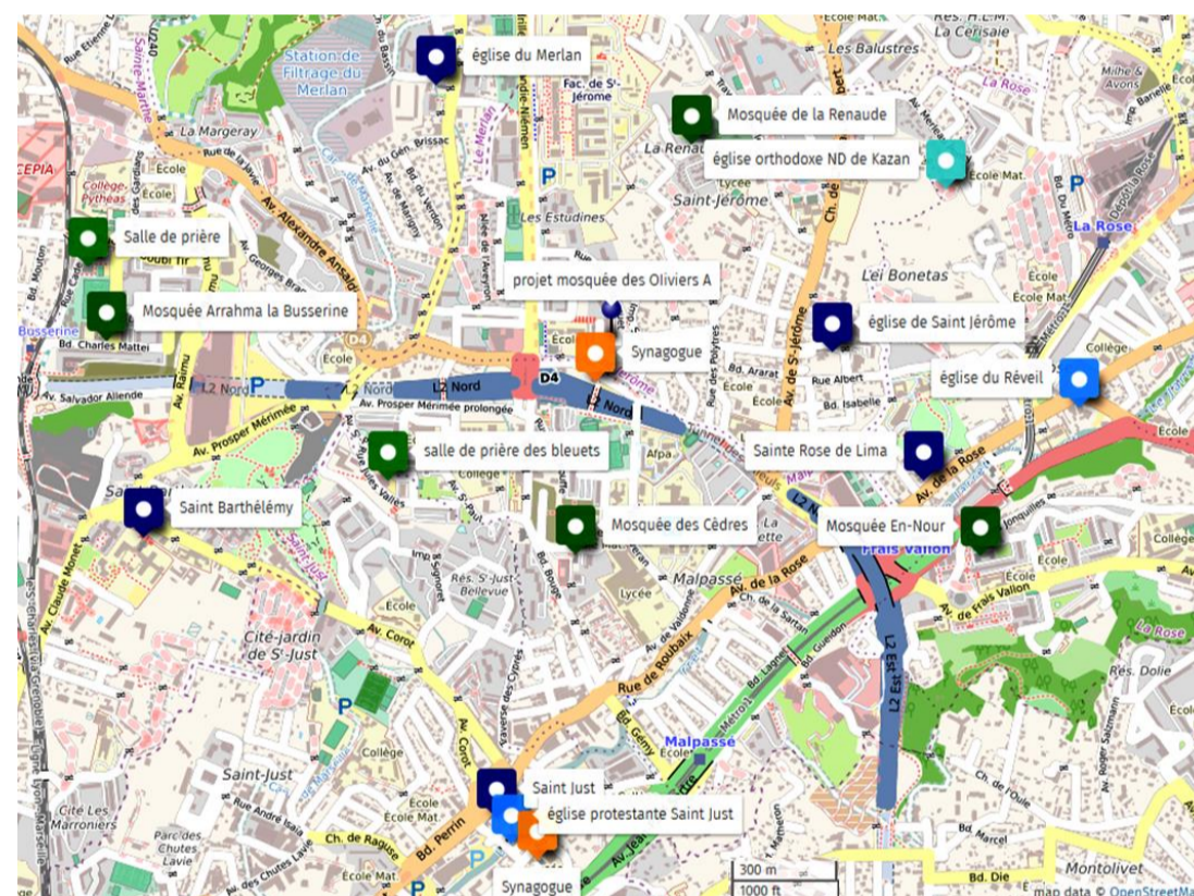
Carte personnelle:

Sur la carte: Chrétiens (Catholique, Orthodoxe, protestant), Juifs, Musulmans, ceci qui rend le quartier très riche et vivant mais il manque de lieux de culte pour les Musulmans.