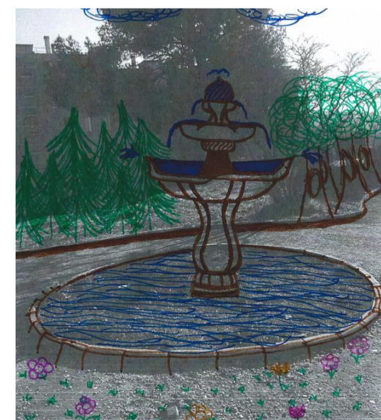
Croquis sur photo personnelle. Paef

« Le droit à la ville » pour tous et toutes